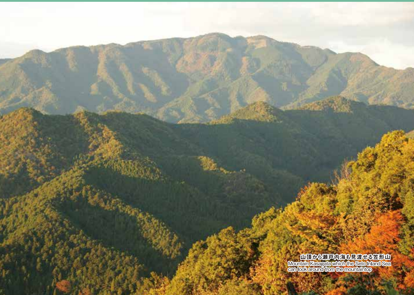
山頂から瀬戸内海も見渡せる笠形山 Mountain Kasagata which the Seto Inland Sea can look around from the mountaintop