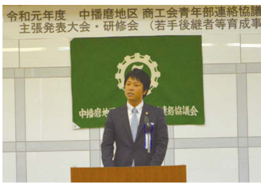
姫路市を代表して主張発表を行う神崎部員