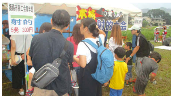
射的にぎわう青年部ブース

商工会青年部もふわふわ遊具を設置し、スピードくじとスーパースクイールを行い、たくさんの子どもたちが賑わいました。 「夢前音頭」の総踊りに続いて、他の花火大会ではみることができない仕掛け花火が音楽と共に始まり、フィナーレにはナイアガラと呼ばれる銀滝が夢前川を照らし夜空を彩りました。