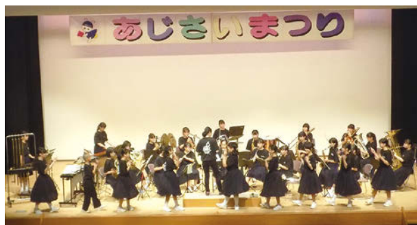
演奏やパフォーマンスを披露する安富中学校ブラスバンド部

6月30日(日)、安富事務所前駐車場・ネスバルやすとみにおいて「あじさいまつり」が開催されました。安富地域を代表する祭りとして、世代を超えて多くの人々に親しまれ、今回で41回目を迎えました。 駐車場では商工会・青年部女性部がスーパースクイールやカレーの販売等をした他、各協賛団体の出展や手作りワークショップがあり、商工会はぜんざいを振る舞いました。 ネスバルでは子どもたちの書道や絵画・地域住民の作品展や地元中学校のブラスバンド演奏、お笑いやものまねのステージイベントがあり当日はたくさんの方の来場者で賑わいました。