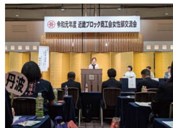
令和元年度近畿ブロック商工会女性部交流会・主張発表大会の様子