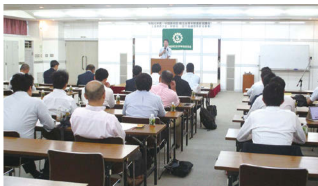
藤尾診断士の講義を熱心に聞く青年部員