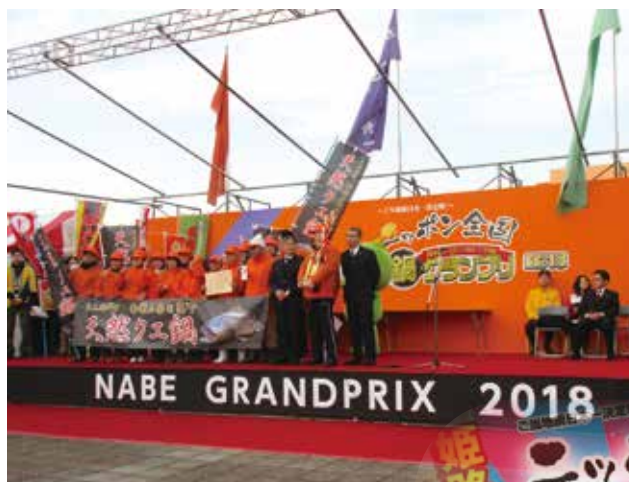
和光市での鍋グランプリ開催風景

毎年、上位3鍋は「J-ブランド鍋」に認定し、歴代メダリスト等による対決の「グランドチャンピオン大会」(2020年開催予定)の出場権を獲得します。