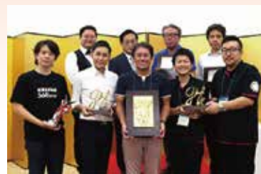
各コンテスト受賞者一同