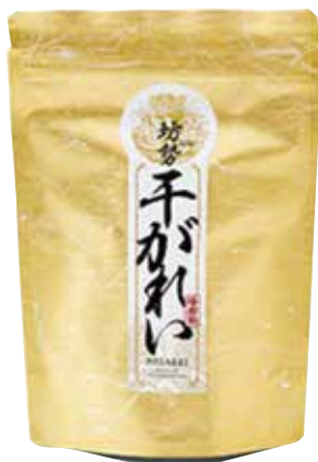
「干がれいの出汁パック」 日洋水産 (姫路市家島町坊勢)

ギフト・ショー会場にご来場いただいた「売りの現場のプロ」の流通バイヤーの皆様の投票結果と、審査員の選考により全ての出展商品の中から選ばれたグランプリ商品です。